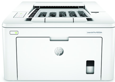
Impresora HP LaserJet Pro M203dn

Obtenga más páginas, rendimiento y protección 1 de una impresora HP LaserJet Pro sin cables alimentada por cartuchos de tóner JetIntelligence. Establezca un ritmo más rápido para su empresa: gestione con facilidad para maximizar la eficiencia e imprima documentos a doble cara de forma instantánea.