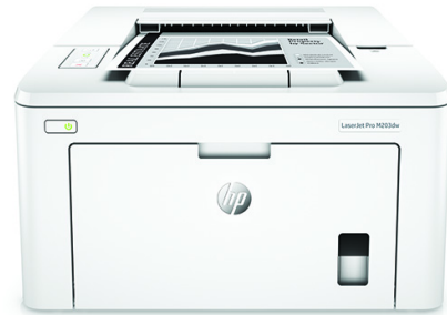
Impresora HP LaserJet Pro M203dw