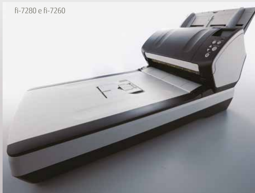
fi-7280 e fi-7260