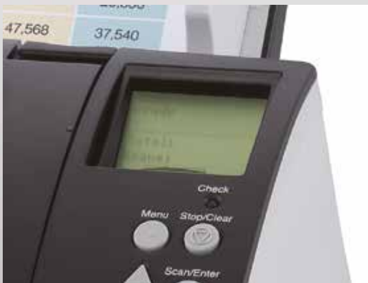
Pannello di comando con display a cristalli liquidi integrato

Gli scanner fi-7180, fi-7280, fi-7160 e fi-7260 sono dotati di funzioni di amministrazione centrale che gli amministratori di sistema possono utilizzare per gestire l'installazione e il funzionamento di più scanner, monitorare lo stato di funzionamento e aggiornare i driver e il software da un'unica postazione. Ciò riduce drasticamente il costo e le operazioni correlate all'installazione, il funzionamento e la manutenzione di molti scanner, consentendo inoltre di espandere la rete degli scanner in postazioni multiple.