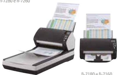
fi-7180 e fi-7160

fi-7160/fi-7260 – verticale A4 a 300 dpi 60 ppm/120 ipm fi-7180/fi-7280 – verticale A4 a 300 dpi 80 ppm/160 ipm Acquisizione di lotti misti, fino a 80 fogli