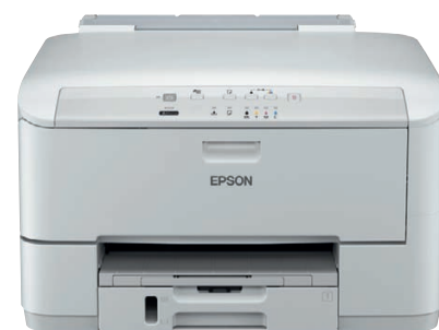
Modelo WP-4095 DN