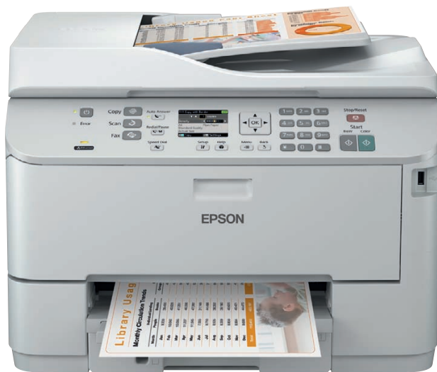
El modelo mostrado es el WP-4595 DNF

Las Epson WorkForce Pro WP-4095 DN y WP-4595 DNF ofrecen lo mejor de ambos mundos: el aspecto de un equipo láser, emulaciones y rendimiento, además de una gran fiabilidad y unos costes de funcionamiento hasta un 50% inferiores 1 .