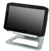
Docking Station Station d'accueil Dockingstation Estación base Base de encaixe

Accessoires en option • Optionale Zubehör • Accesorios opcionales • Acessórios opcionais