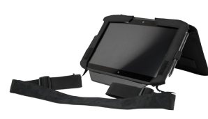
Work Anywhere Kit Kit Work Anywhere Work Anywhere Kit Kit de Work Anywhere Kit Trabalhe em Qualquer Lugar