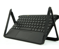
Companion Keyboard Clavier Companion Companion Tastatur Teclado Companion Teclado Companion

For more accessories, go to motioncomputing.com/us/products/rugged-tablets/r12#prod_acc