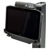
Secure Mobile Dock Station d'accueil mobile sécurisée Mobile Dockingstation mit Sicherung Base móvil segura Encaixe móvel e seguro