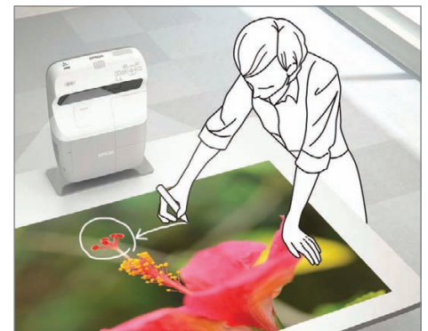
Proyecta sobre cualquier superficie horizontal, por ejemplo una mesa