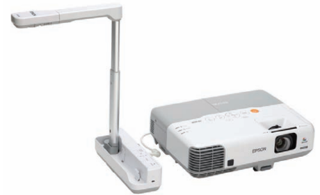
Comparte objetos en 3D con la cámara de documentos Epson ELP-DC06