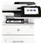
LaserJet Managed MFP E52645