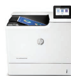
Color LaserJet Managed E65160