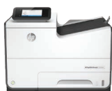
Impresora PageWide Managed P55250