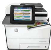
Impresora multifunción PageWide Managed E58650