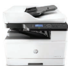
Impresora multifunción LaserJet M436 15