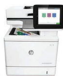
Impresora Color LaserJet Managed E57540