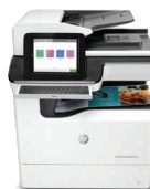
Impresora multifunción PageWide Enterprise Color 785 26