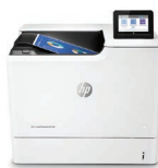
Impresora Color LaserJet Impresora Managed E65150