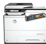
Impresora multifunción PageWide Managed P57750