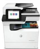
Impresora multifunción PageWide Enterprise Color 780