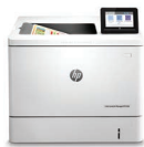
Impresora Color LaserJet Managed E55040