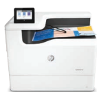
Impresora PageWide Color 755