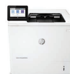
LaserJet Managed E60165