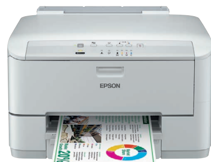
Modelo WP-4015 DN