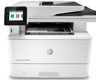
Impresora multifunción HP LaserJet Pro M428fdw

Impresora con seguridad dinámica habilitada. Para ser exclusivamente utilizada con cartuchos que utilicen un chip original de HP. Es posible que no funcionen los cartuchos que no utilicen un chip de HP, y que los que funcionan hoy no funcionen en el futuro. Obtenga más información en: http://www.hp.com/go/learnaboutsupplies