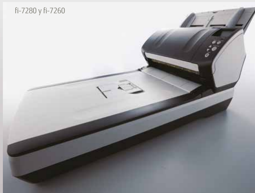
fi-7280 y fi-7260

Los Carrier Sheets permiten escanear documentos mayores que A4, o fotografías y recortes que sufran el riesgo de quedar dañados al ser procesados mediante el ADF. {Ref. de pieza – PA03360-0013}