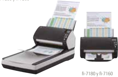
fi-7180 y fi-7160

fi-7160/fi-7260 – A4 vertical a 300 ppp 60 ppm / 120 ipm fi-7180/fi-7280 – A4 vertical a 300 ppp 80 ppm / 160ipm Digitalice lotes mezclados mediante el alimentador de 80 hojas